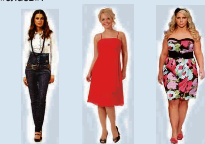
Представитель конституции «ветер», Представитель конституции «желчь», Представитель конституции «слизь»

В тибетской медицине организм человека – это единая система, основой которой являются три жизненных начала (конституции, доша) «ветер», «желчь» и «слизь».