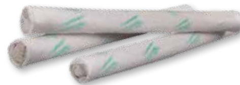
Полынные моксосигары производства «Наранфито» можно приобрести в филиалах клиники тибетской медицины «Наран» и интернет-магазине, тел. 8-800-333-14-00

и рекомендациями по их использованию самостоятельно в домашних условиях. В этом издании описаны 6 основных биологически активных точек, которые называют «точками скорой помощи». Если прогревать их полынными сигарами, безо всяких лекарственных препаратов можно избавиться от головных болей, ОРЗ, бессонницы или стресса.