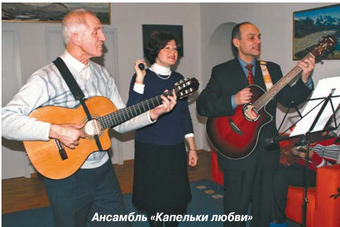
Ансамбль «Капельки любви»

Во время отбора финалистов произошло маленькое чудо. В конкурсе участвовал супруг одной из пациенток клиники с тяжелым диагнозом «рассеянный склероз» и занял второе место. Его жена нуждается в лечении каждые полгода, после двух курсов наступило значительное улучшение, но на третий курс они не пришли. Лечащий врач, узнав, что у па-