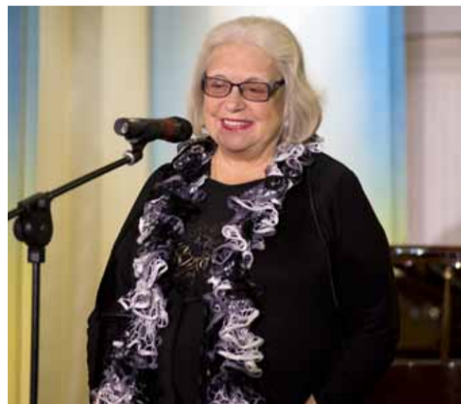
Народная артистка РСФСР Лидия Федосеева-Шукшина