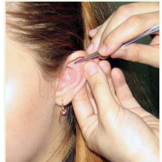
Пациентка клиники «Наран» на приеме у врача-аурикулотерапевта