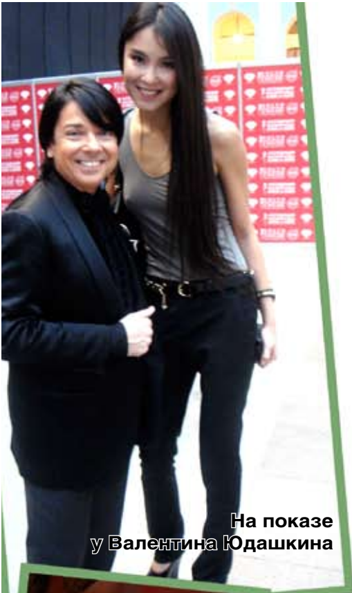
На показе у Валентина Юдашкина

Учредитель издания – клиника «Наран». Выходит два раза в месяц с июня 2005 года. www.naran.ru