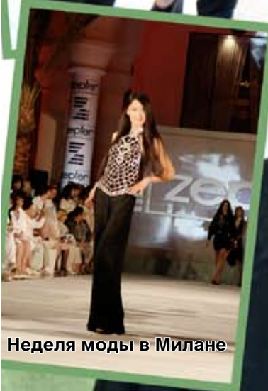
Неделя моды в Милане