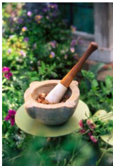
Все тибетские фитопрепараты изготавливают вручную

Сочетание фитотерапии с внешними методами воздействия – лечебными процедурами: точечным массажем, моксотерапией, вакуумным массажем, иглокалыванием, стоун-терапией, компрессами по авторским методикам «Нарана» составляют единый комплекс мер, взаимно усиливающих лечебный эффект при хронических заболеваниях.