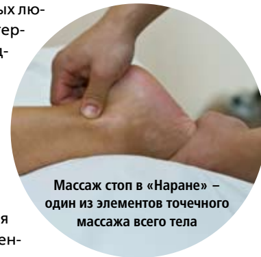
Массаж стоп в «Наране» – один из элементов точечного массажа всего тела

Без правильного лечения подверженный артрозу сустав создает порочный круг – не только разрушается сам, но и нарушает биомеханику позвоночника и других суставов, мышечной системы; отсюда грыжи межпозвоночных дисков и артроз других суставов. Фитопрепараты тибетской медицины помогают очистить кровь и сосуды, наладить кровообращение в мелких и крупных сосудах. Прижигание полыньными сигарами и точечный массаж зон меридиана почек, мочевого пузыря, расположенных на подошвах стоп, а также точек вблизи суставов, дает противовоспалительный эффект, стимулирует регенерацию хрящевой ткани. Иглокальвание нормализует циркуляцию энергии и крови, артериальное давление, корректирует сосудистые патологии, устраняет воспаление и болевой синдром.